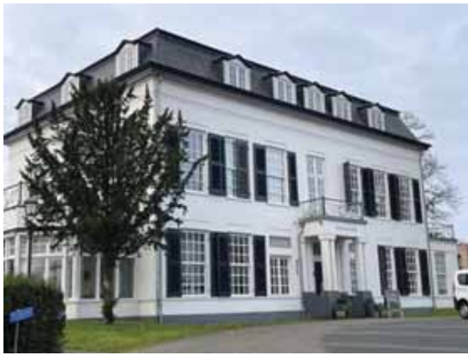
Papagena huis aan de Naarderstraat in Laren

zorgen voor een gevarieerd programma, met etentjes, tochtjes, informatie-bijeenkomsten, museumbezoek en noem het maar. Begin april de Paaslunch en in mei het bezoek aan het Papageno-huis'