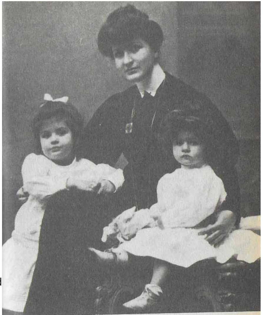
Op zeventwintigjarige leeftijd met haar twee dochtertjes. 'Mijn God, wat is er toch van mijn plannen, mijn mooie plannen terechtgekomen?'

Pas aan het eind van zijn leven beseftte Mahler dat hij zijn vrouw ernstig tekort had gedaan. Dat heeft hij geprobeerd goed te maken, maar helaas werd hij erg ziek, hij had een hartkwaal en hij overleed in 1911. Alma werd weduwe toen ze 32 was, ze had ook al haar